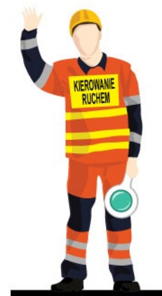
Rys. 4. Kierujący ruchem