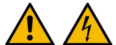
Rys. 2. Przykładowe znaki bezpieczeństwa – znaki ostrzegawcze: „Uwaga!”, „Grozi porażeniem prądem”