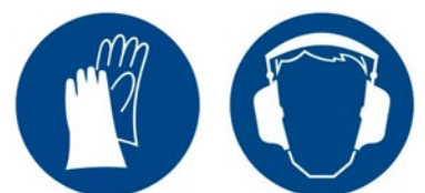
Rys. 3. Przykładowe znaki bezpieczeństwa – znaki nakazu: „Nakaz stosowania środków ochrony”