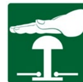
Rys. 4. Przykładowe znaki bezpieczeństwa – znaki informacyjne: „Wyłącznik awaryjny”