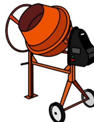
Rys. 5. Osłona elementów napędowych