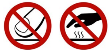
Rys. 1. Przykładowe znaki bezpieczeństwa – znaki zakazu: „Zakaz dotykania”, „Powierzchnia gorąca”