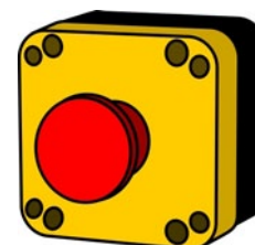
Rys. 6. Awaryjny wyłącznik bezpieczeństwa